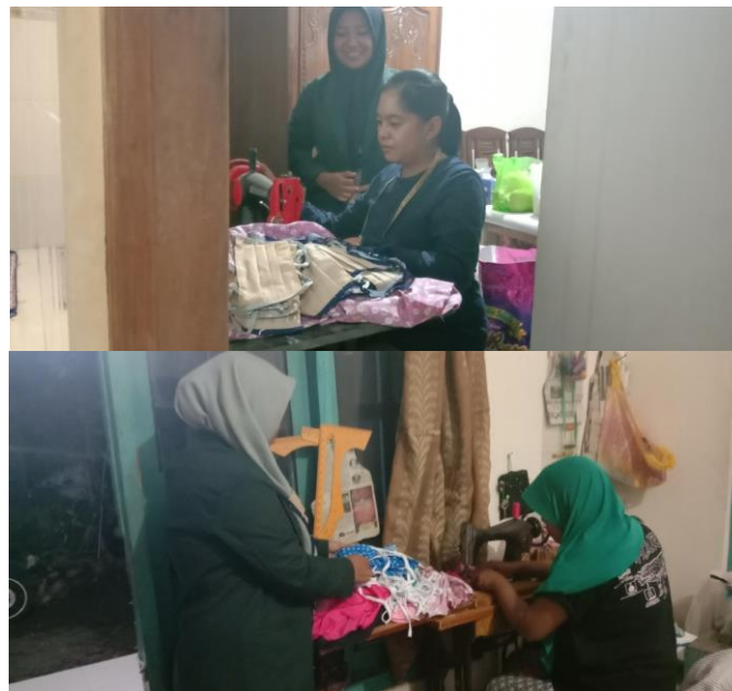
Bekerjasama dengan penjahit lokal