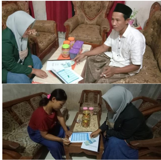
Penggalangan swadana masyarakat