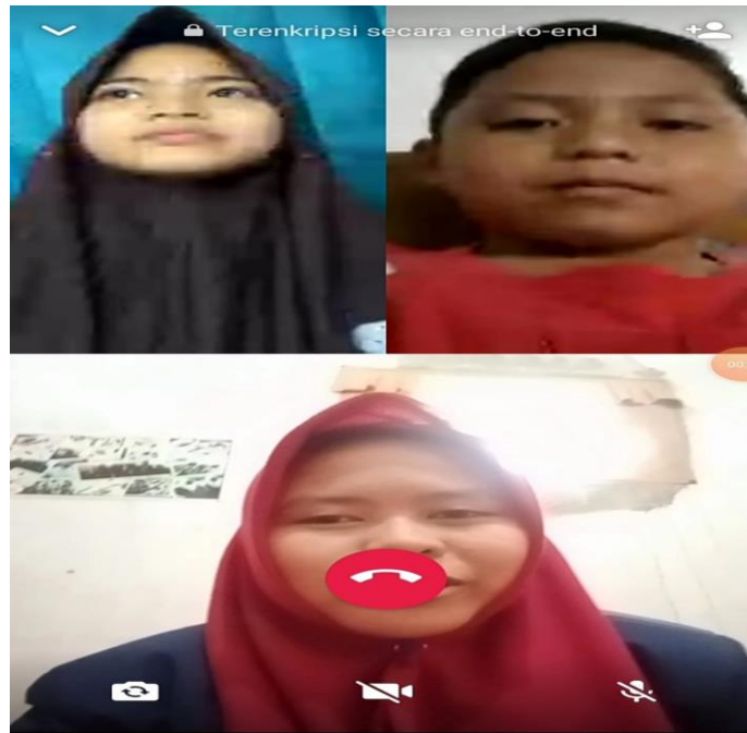
Tampilan saat pembelajaran online berlangsung