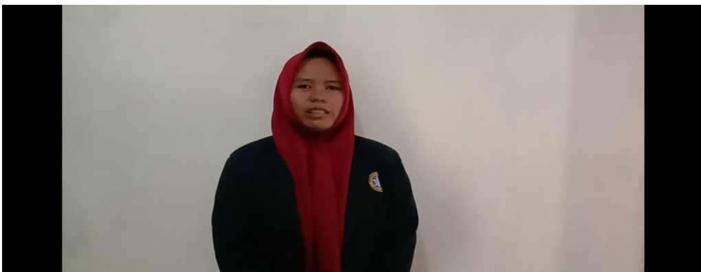
Foto pembuatan video