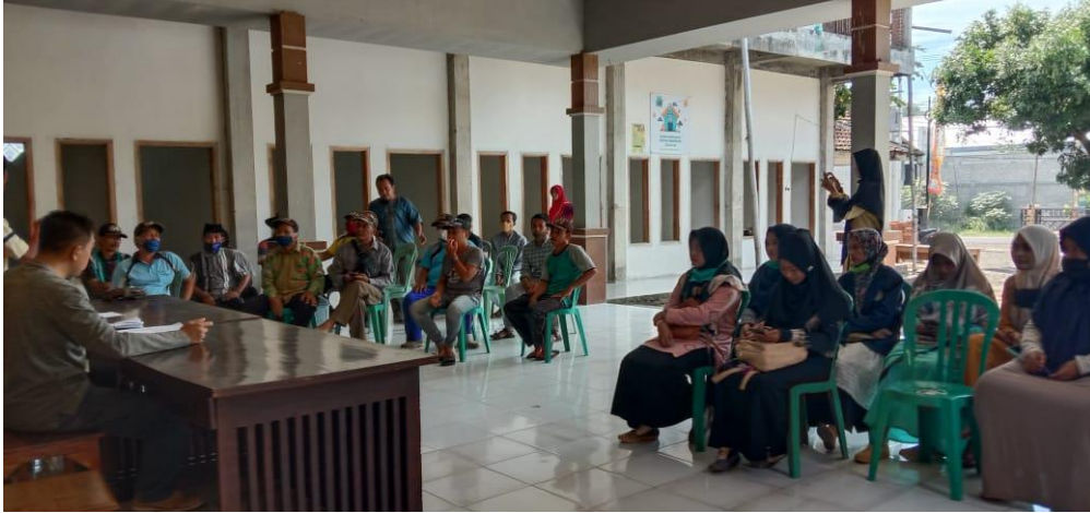
Rapat bersama dengan kepala Desa Trebungan