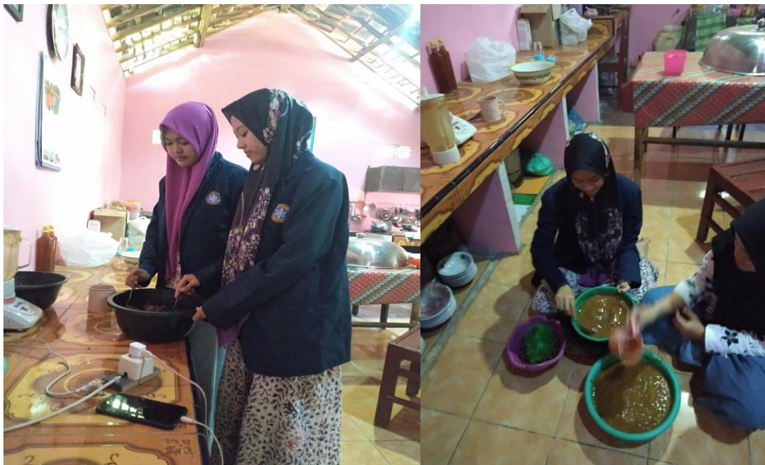
Pembuatan dan pengelolaan sari kurma