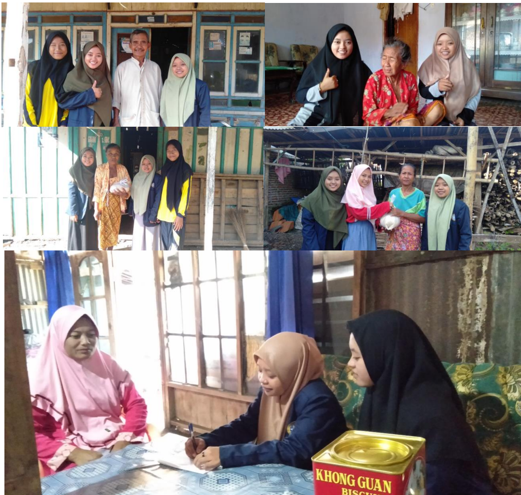
Santunan bagi warga terdampak