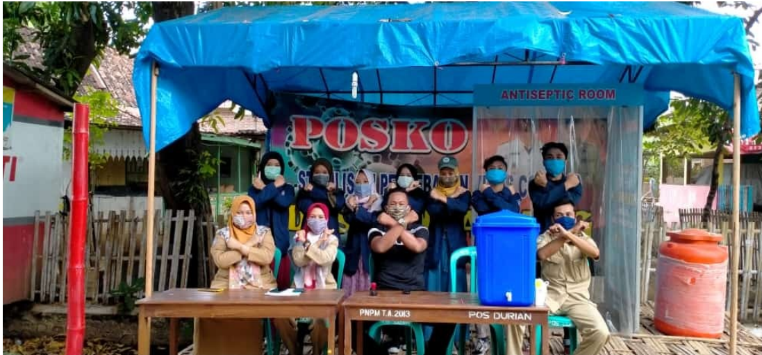
Gambar : Penjagaan posko di dampingi perangkat desa