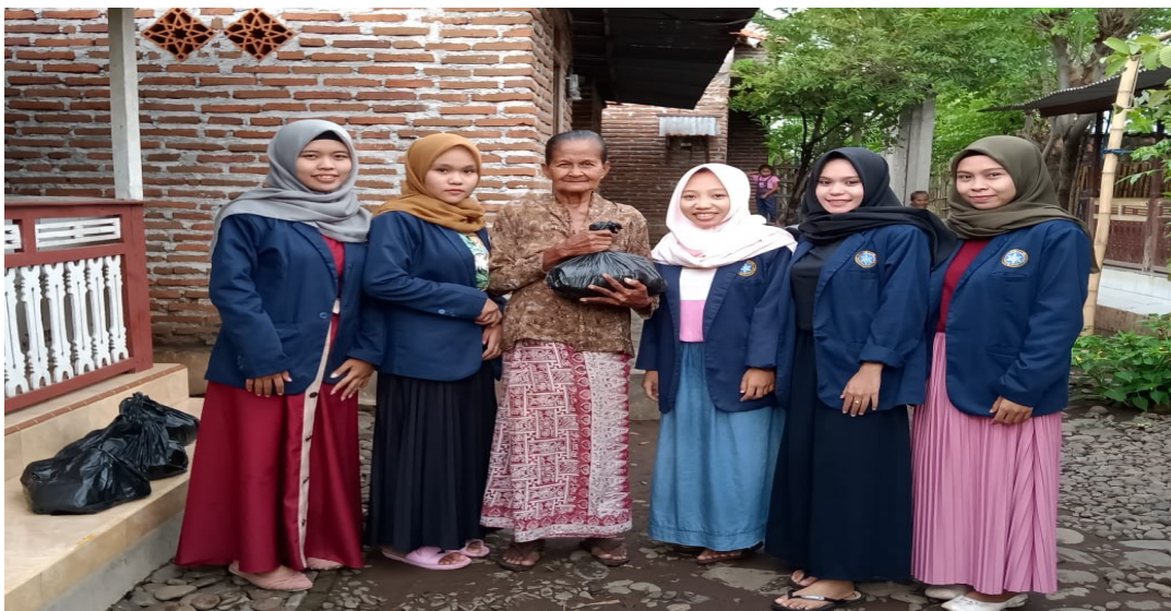
Gambar : Bantuan sejahtera berupa sembako