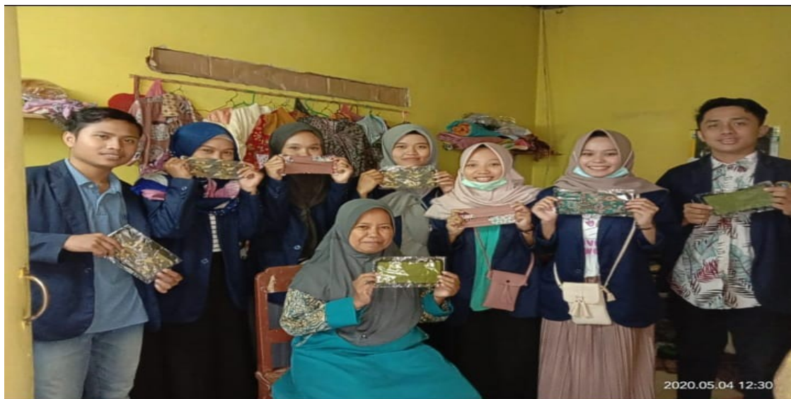
Gambar : Wawancara pembuatan masker Desa Lubawang