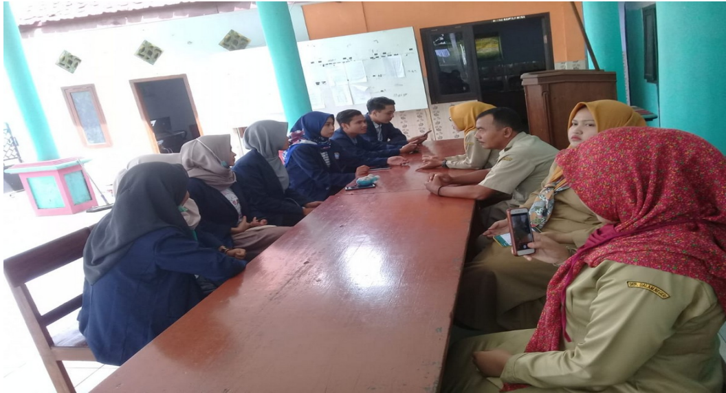
Gambar : Melakukan koordinasi dengan perangkat desa