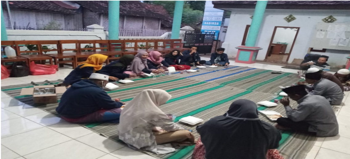
Gambar : Istigosah dan buka bersama dengan perangkat desa