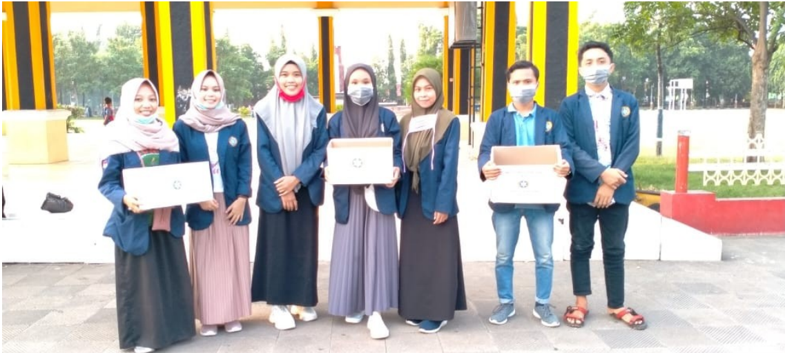
Gambar : Penggalangan dana