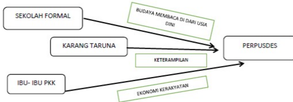
Gambar 2.1. Rancang Bangun Strategi Aksi

Untuk mencapai kondisi yang diharapkan sebagaimana yang dijelaskan di depan, dibutuhkan beberapa strategi khusus yang gambarnya sebagai berikut: