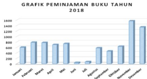
Sumber: PERPUSDES Sang Juara

Jumlah koleksi buku di PERPUSDES Sang Juara sebanyak 2.126 judul buku dari berbagai jenis. Sedangkan jumlah peminjaman buku meningkat pesat menjadi 8.262 sejak bulan Maret – Desember 2018.