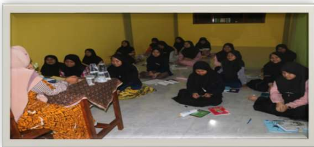
Berikut Dokumentasi Kegiatan Pembelajaran Materi perjilid Amtsilati:

Kelima: Kegiatan penutup, dengan membaca do'a yang dipimbin langsung oleh ustadz.