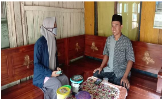
Foto saat observasi serta wawancara bersama guru penanggung jawab sekolah SMK IBNU KHOLDUN AL-HASYIMI cabang desa cemara.

Foto bersama salah satu perangkat desa sekaligus mewakili kepala desa dalam memberikan arahan, informasi serta data yang kami butuhkan.