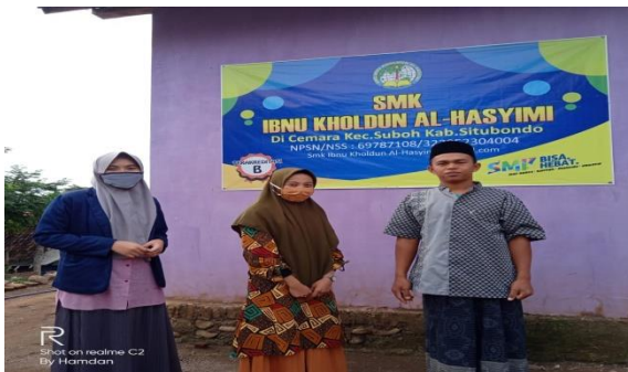
Foto bersama salah satu guru yang bersedia membantu program belajar online.

Foto saat observasi serta wawancara bersama guru penanggung jawab sekolah SMK IBNU KHOLDUN AL-HASYIMI cabang desa cemara.