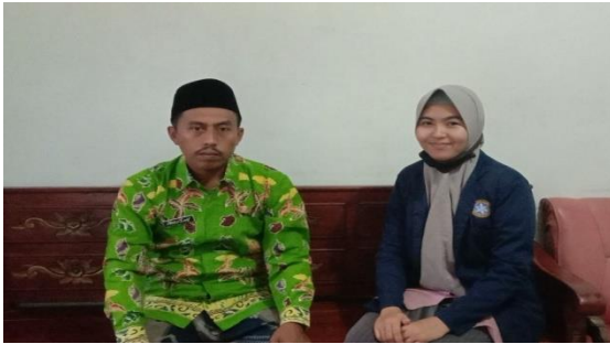
Foto bersama salah satu perangkat desa sekaligus mewakili kepala desa dalam memberikan arahan, informasi serta data yang kami butuhkan.