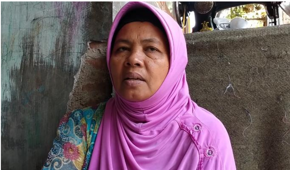
Ketua LPK RH ketika di wawancarai