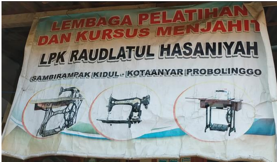
Banner yang terpajang didepan lembaga