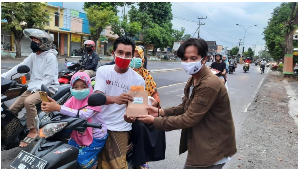
Gambar 16 Proses Pembagian Takjil2