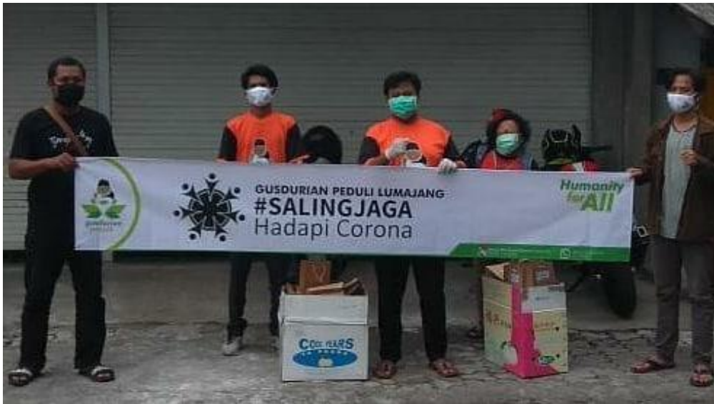
Gambar 15 Proses Pembagian Takjil1

Dalam masa Pandemi Covid-19 ini, kita bertepatan dengan Bulan Ramadhan dimana masyarakat yang biasanya disore hari masih keluar untuk mencari Takjil Buka Puasa. Disini kita melakukan bagi bagi Takjil, Dimana Makanan yang berbentuk takjil ini kita menggunakan makanan – makanan yang meningkat daya imun tubuh untuk menghadapi covid-19. Seperti Telur Rebus Dan Sup Kacang Hijau beserta Roti Putih.