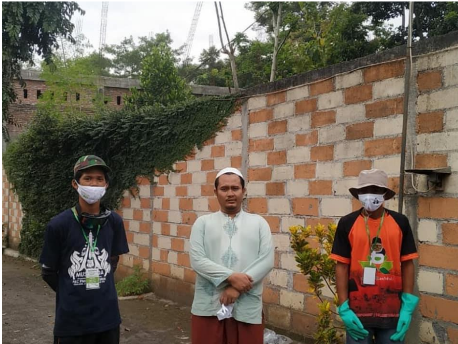
Gambar 8 Gambar Dengan Pengasuh Pondok Pesantren