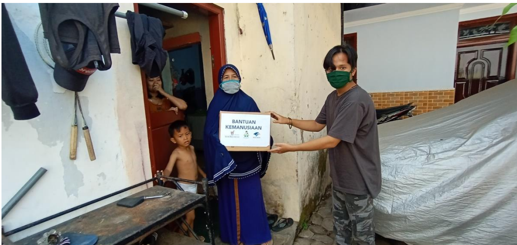
Gambar 4 Bagian Penyaluran Sembaku3