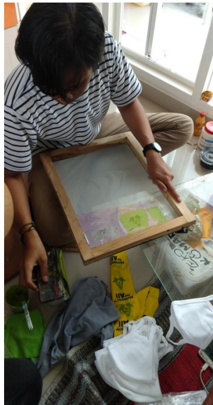
Gambar 6 Pembuatan Masker 2