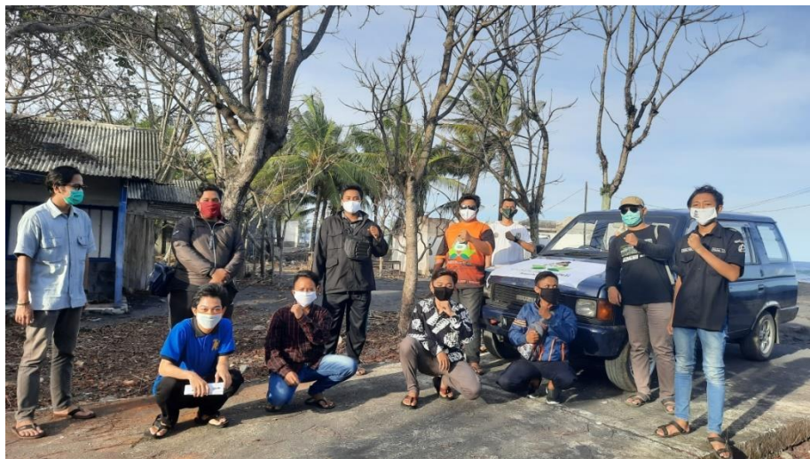
Gambar 11 Sampainya Relawan Ke Lokasi Korban Abrasi