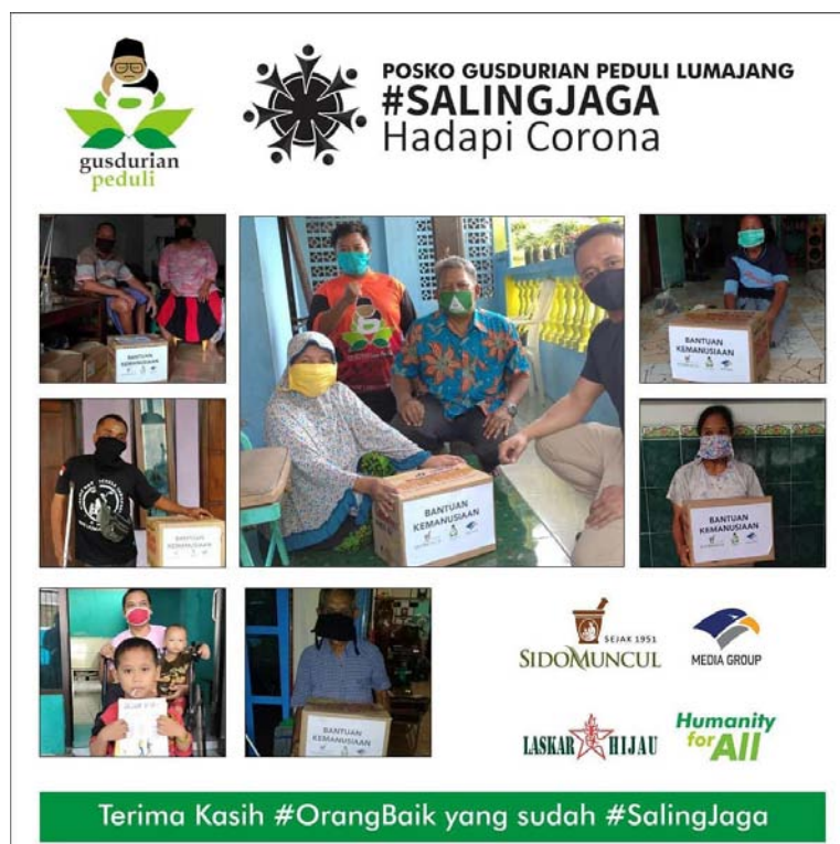
Gambar 1 Doc Gusdurian Lumajang Penyaluran Sembako

Penyaluran Sembako, 200 Paket Sembako berisi Minyak goreng 1 L, Beras, 5Kg, 1 pack SidoMuncul, 1 Pack UC100, Mie Sedap 8Pcs, Biskuit 1Toples, Kita mendapatkan paket Sembako ini dari Sido Muncul dan Media Gulp. Dan kita Salurkan di 11 Kecamatan di Kabupaten Lumajang terutama yang berstatus Zona Merah.