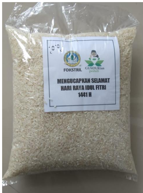
Gambar 10 Contoh Paket Zakat

Disini kita melakukan Pembagian Zakat yang sudah terkumpul dari pengglangan Zakat dan Donasi secara online melalui Flayer/Phamplet maupun secara offline dengan siap jemput ke tempat lokasi. Kita mendapatkan 100 paket Zakat yang terkumpul dari kalangan msyarakat Luamajang yang kita salurkan kepada korban yang terkena Abrasi didaerah pesisir Tempursari Kabupaten Lumajang.