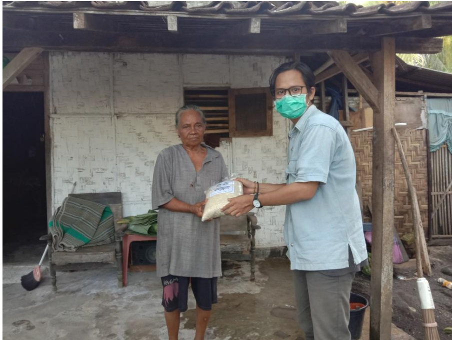
Gambar 12 Proses Pembagian Zakat1