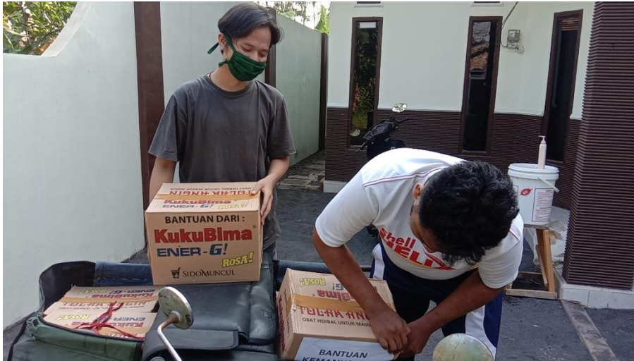
Gambar 2 Bagian Penyaluran Sembako