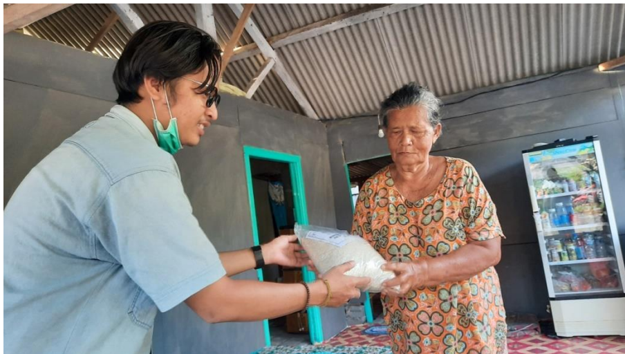
Gambar 13 Proses Pembagian Zakat2