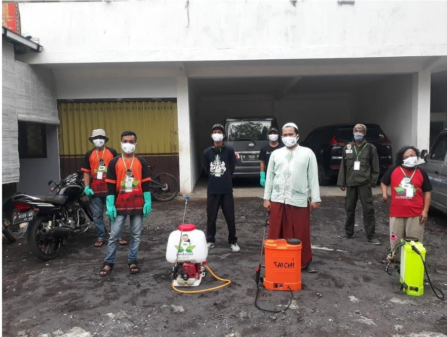
Gambar 7 Penyemprotan Disinfectan I

Penyemprotan Disinfectan Di Pondok Pesantren Darun Najah Di Desa Petahunan Kecamatan Summersuko Kabupaten Lumajang. Dimana kegiatan Santri disana masih seperti biasa.