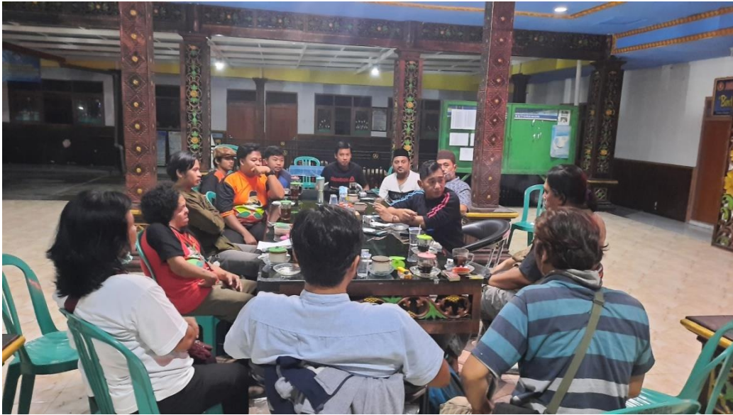
Gambar 14 Rapat Dengan Perangkat Desa Terkait Desa Binaan

Desa Binaan adalah dimana sebuah Program yang tertuju pada suatu Desa Sebagai Contoh untuk melakukan penanganan atau Protokol Covid-19, dimana kegiatan kegiatan pada desa tersebut seperti pemasangan tempat Cuci Tangan, Penyemprotan DisInfectan , Penyuluhan Edukasi tentang Edukasi Covid-19 dan melakukan kegiatan yang masih tetap Produktif pada desa tersebut meskipun masih Dirumah Saja. (Kegiatan Masih Dalam tahap Koordinasi Dengan Perangkat Desa).