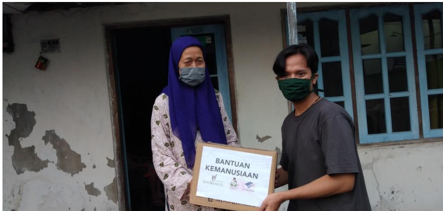
Gambar 3 Bagian Penyaluran Sembako2