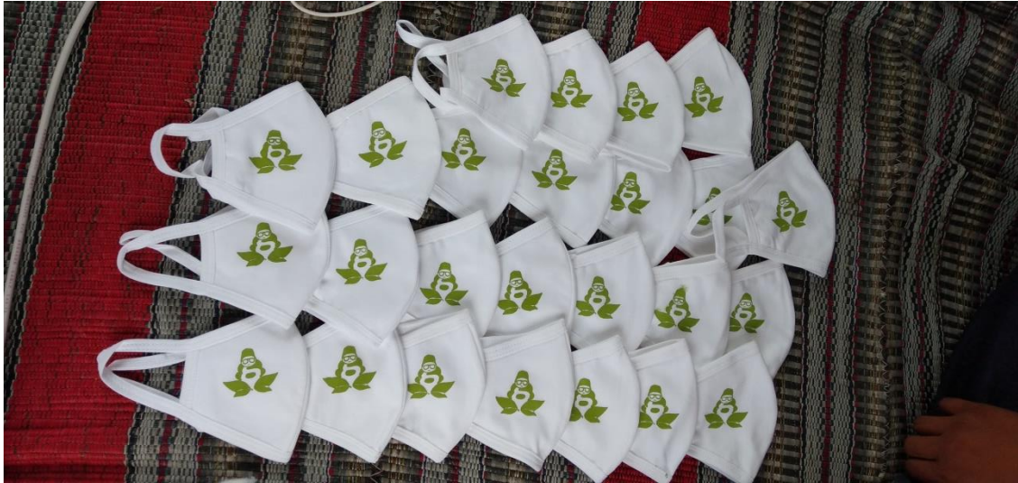
Gambar 5 Pembuatan Masker 1

Sebagian Dari Donasi kita Akokasikan ke Pembuatan Masker sebanyak 200 Buah. Dan kita sebarkan ke 2 Masjid Besar di Kabupaten Lumajang dan Pengendara di Area Kota.