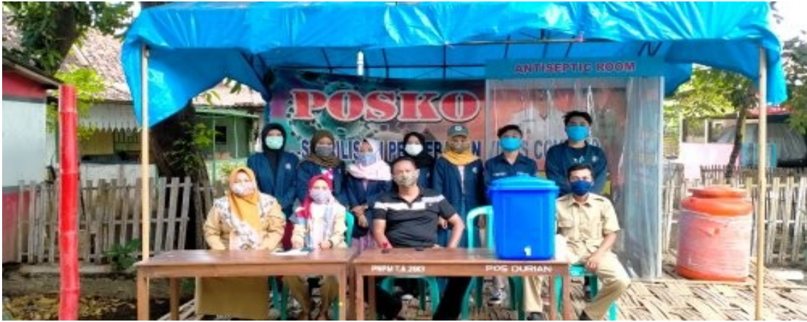
Gambar : penjagaan posko di damping prangkat desa