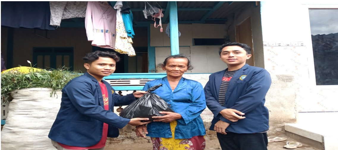
gambar : bantuan sejahtera berupa sembako