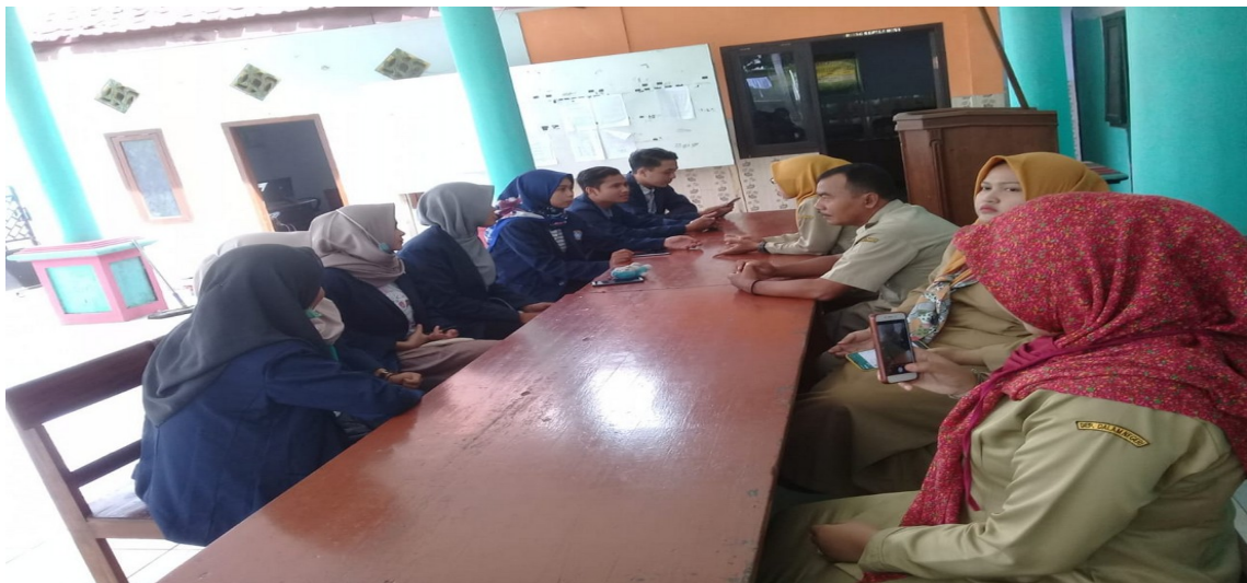
Gambar : melakukan koordinasi dengan prangkat desa