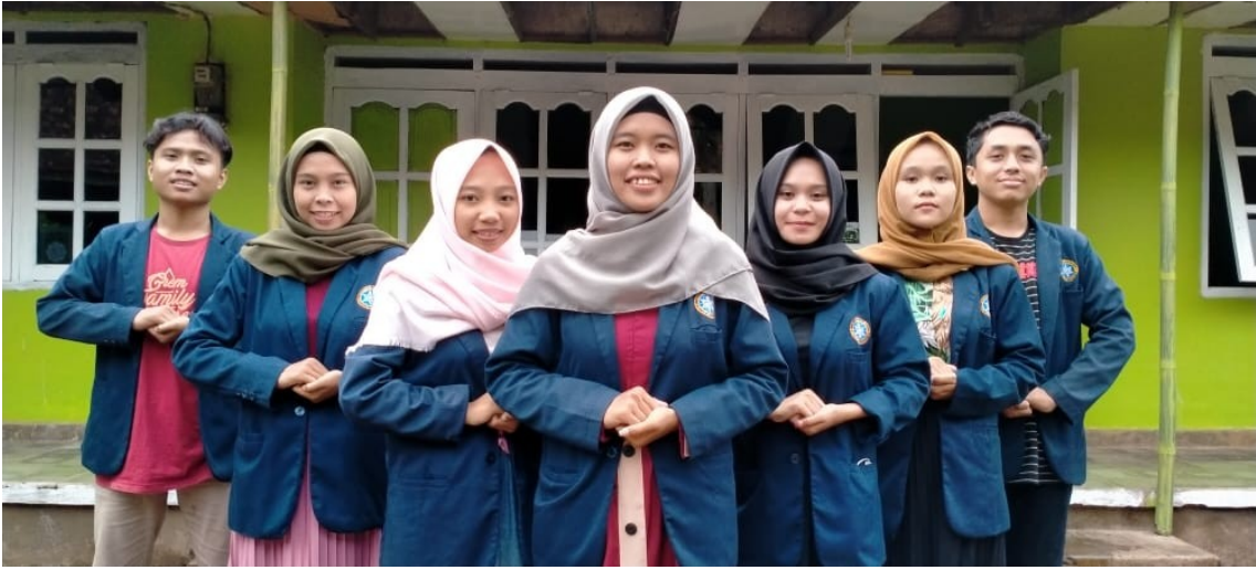
Gambar : foto bersama dengan peserta PKM desa lubawang