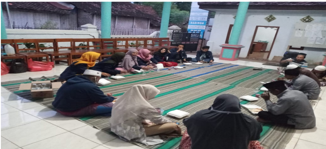
Gambar : istigosah dan buka bersama dengan prangkat desa