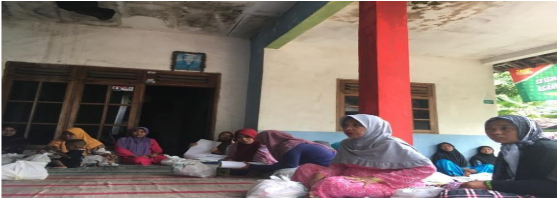
Memberi pemahaman cara pengoptimalkan lahan