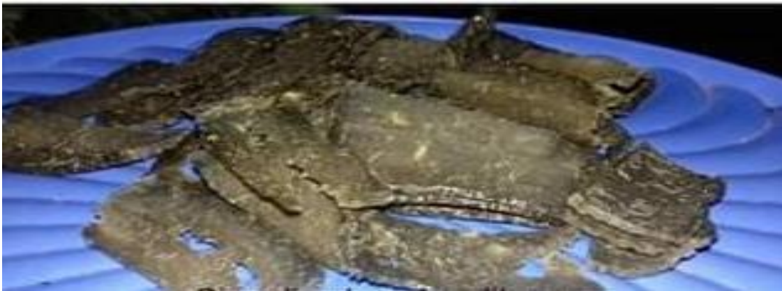
Produk krupuk kangkung