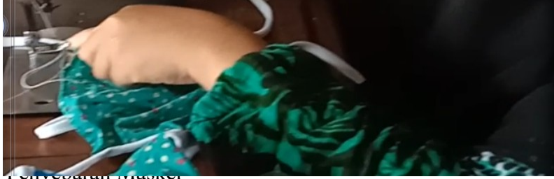
1. City Court Masker