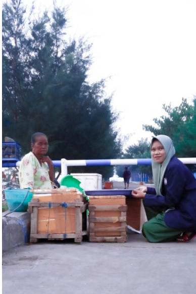
Wawancara dengan pedagang ikan desa setempat.