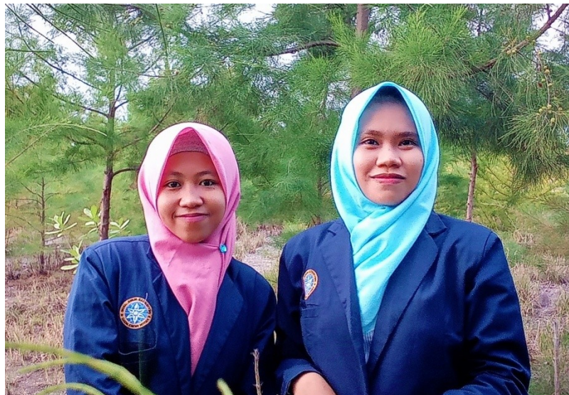
Kerja sama antar peserta kegiatan PKM