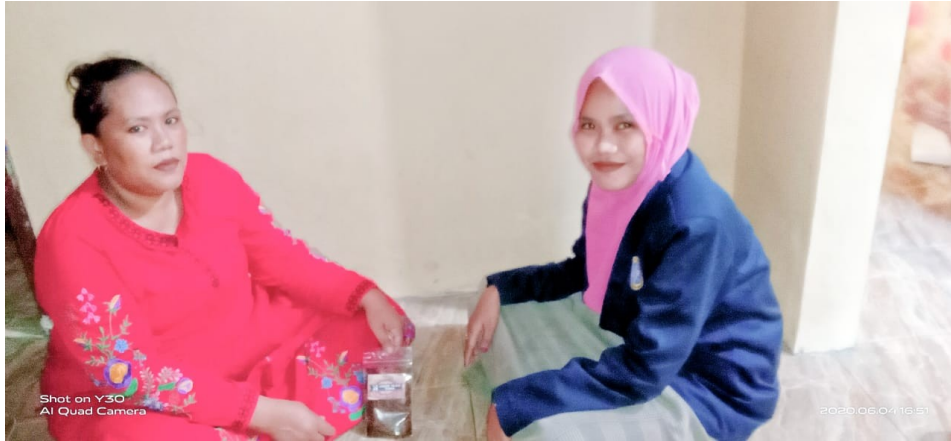
Pemahaman tentang proses pembuatan abon ikan