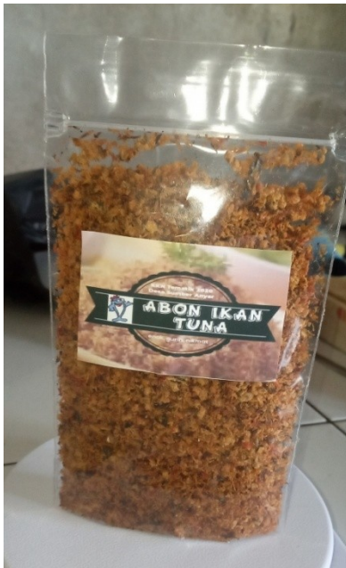
Produk yang dihasilkan