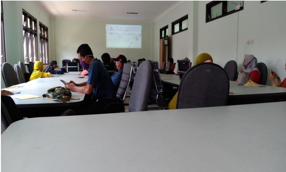
Foto Rapat untuk melakukan home schooling