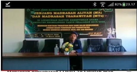
Mencegah penyebaran COVID-19 Sekolah man 2 probolinggo menerapkan Home Schooling