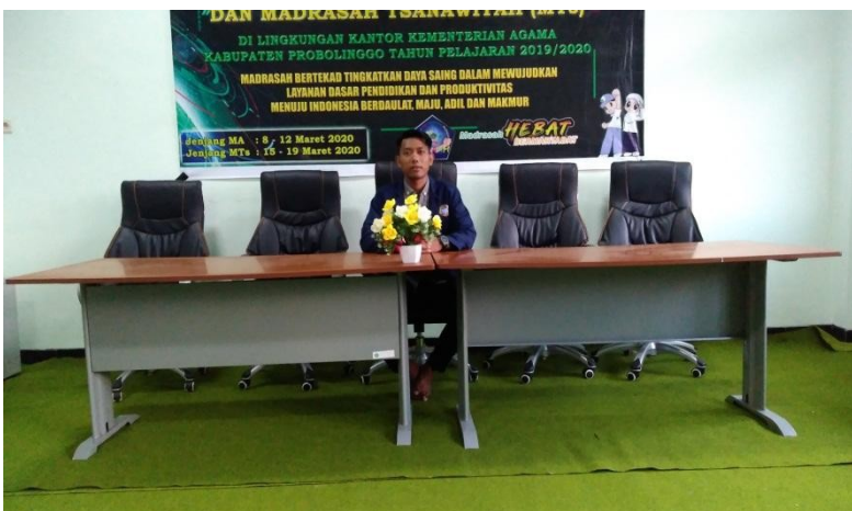
Foto saat membuat video penyuluhan didepan kamera