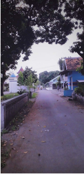
Keadaan Desa Sumberan selama masa Lockdown