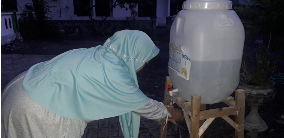
Foto salah satu Masyarakat sedang Cuci tangan