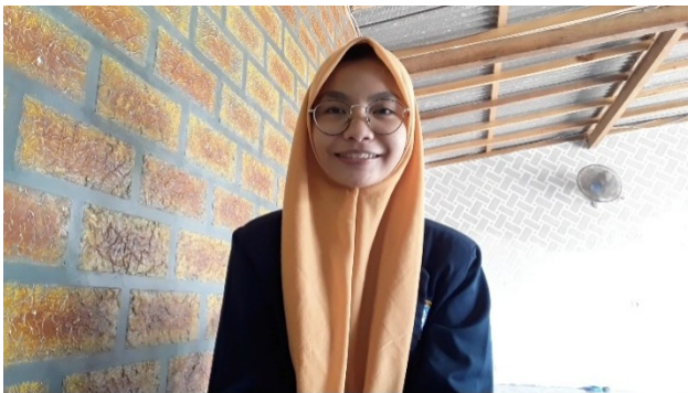
Foto saat membuat video penyuluhan didepan kamera