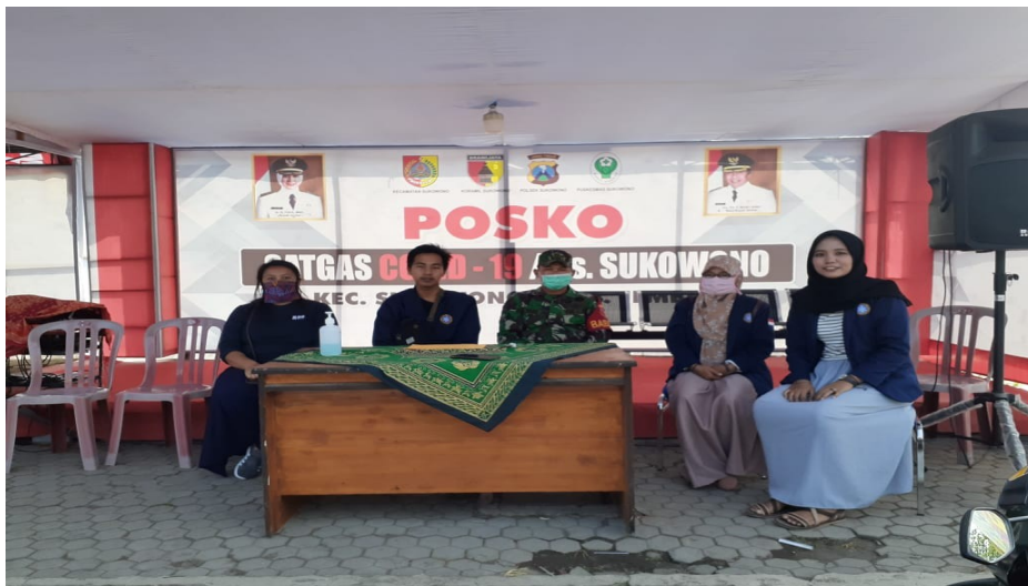
Gambar 5 : Relawan penjagaan posko covid-19 di Desa Sukowono.

Dimana pihak perangkat desa juga melaksanakan pencegahan penyebaran covid. Dengan upaya penjagaan posko di sebelah utara pasar induk sukowono dan menyediakan tempat karantina di rumah sakit sukowono. Yang mana dalam tiap harinya penjagaan di optimalkan dengan membagi tiga shift setiap harinya terdiri dari tiga orang dari perangkat desa. Yang mana di posko ini memeriksa apabila ada warga