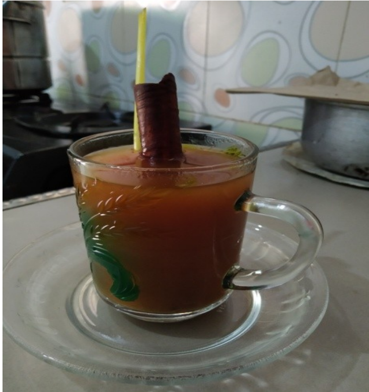
Gambar 3 : jamu Tradisional

Jamu tradisional ini terbuat dari bahan-bahan alami yang mana bahannya adalah kunyit, sereh, jahe, kayu manis dan gula aren. Proses pembuatannya yaitu: