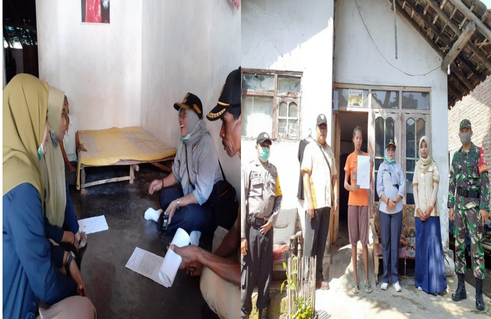
Gambar 6 : Memebagikan dana bantuan BLT kepada masyarakat yang kurang mampu Di Dusun Potok Timur Desa Sukowono.

Dimana pelaksanaan pembagian bantuan dana BLT ini untuk meringankan ekonomi masyarakat pada masa pandemi ini. Dana BLT ini diberikan kepada masyarakat yang kurang mampu sebesar Rp 6.00.000 selama 3 bulan Mei-Juli, dimana Kepala Desa dan juga Kerabat Desa dan Pihak kepolisian ikut serta membantu untuk mensukseskan kegiatan ini.