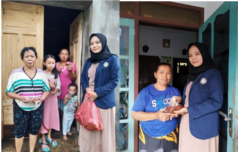
Gambar 4 : Membagikan jamu gratis kepada masyarakat Desa Sukowono

Dengan membagi-bagikan jamu gratis banyak sekali yang berpartisipasi untuk mensukseskan kegiatan PKM ini, dimana banyak sekali dukungan dari masyarakat setempat dengan adanya pembuatan jamu tradisional ini untuk pencegahan virus Covid-19.