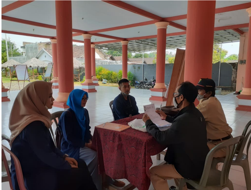
Gambar 2: Rapat rencana PKM yang akan dilakukan untuk menanggulangi Covid-19 di Desa Sukowono.

Dimana rapat yang dilaksanakan dengan perangkat desa tentang rencana kerja PKM UNUJA sangat memotivasi kami, karena banyak sekali dukungan dan kerja sama untuk mensukseskan PKM tematik covid-19 ini. Dimana banyak sekali kegiatan diantaranya adalah penjagaan posko covid-19, membagi-bagikan jamu gratis kepada masyarakat dan juga bantuan dana BLT bagi masyarakat yang kurang mampu.