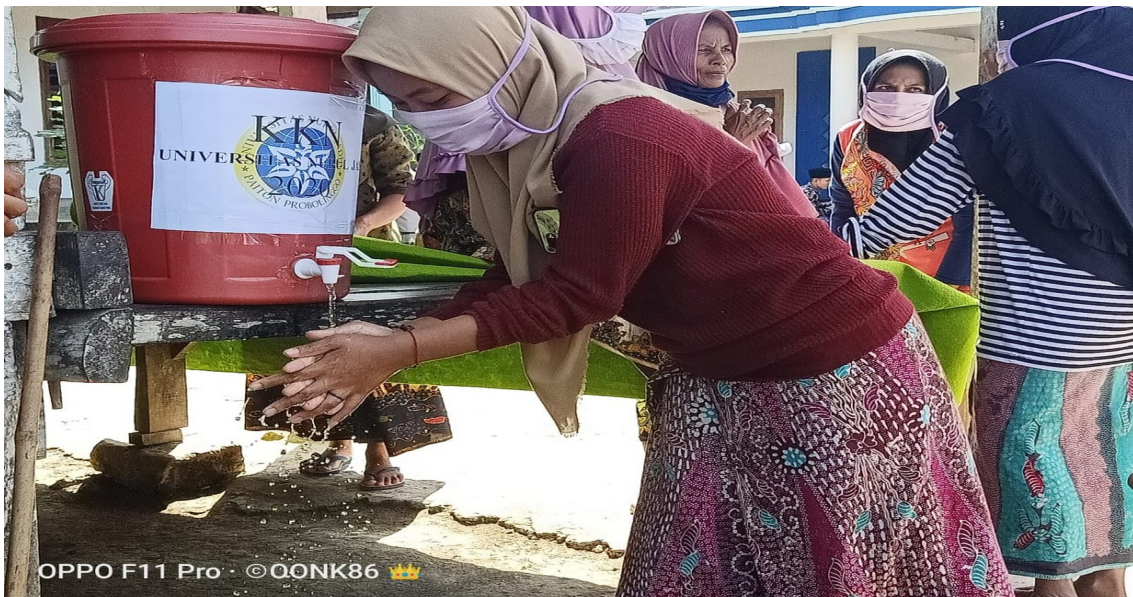
Peraktek Cuci Tagan masyarakat