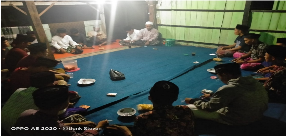
Rapat Perdana PKM bersama Anak nuda Karangpenanag

(Berisi Foto Dokumentasi saat melaksanakan kegiatan)