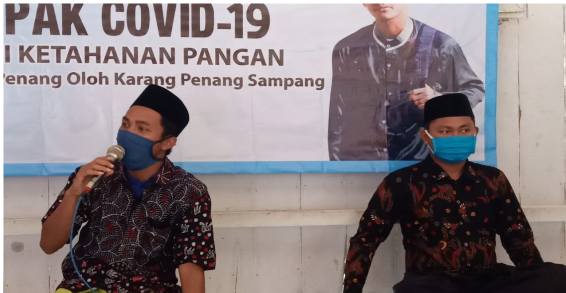
Sosialisasi tentang pendampingan penanggulangan dampak covid-19 melalui ketahanan pangan keluarga kepada masyarakat