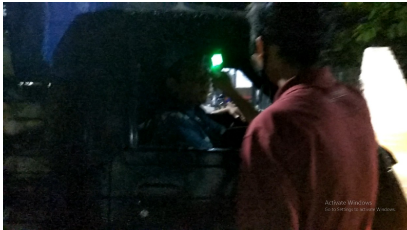
Foto capture video cek poin