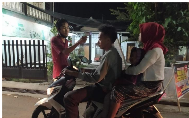
Foto masyarakat yang tidak mematuhi protokol kesehatan.