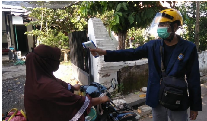
Foto masyarakat yang mematuhi protokol kesehatan.