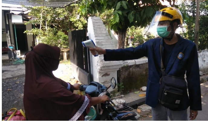
Foto masyarakat yang mematuhi protokol kesehatan.