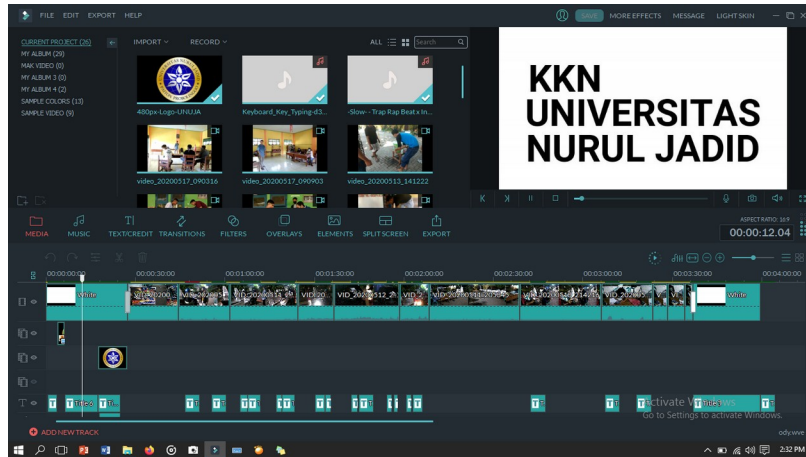
Proses editing video