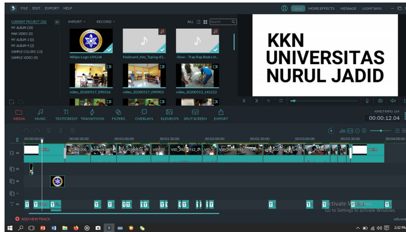
Proses editing video

(Berisi foto dokumentasi saat melaksanakan program PKM)