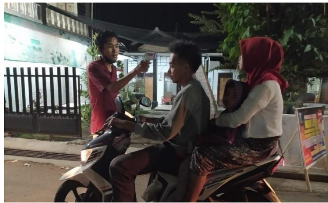
Foto masyarakat yang tidak mematuhi protokol kesehatan.