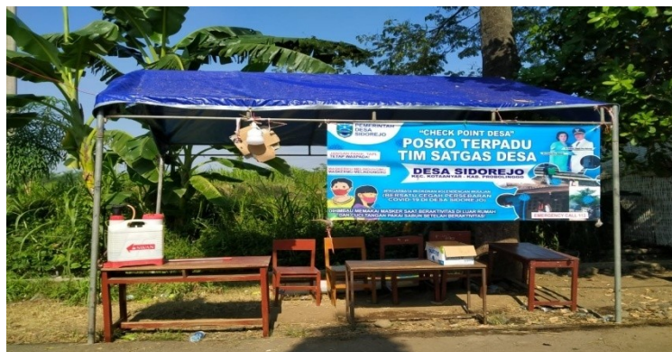
Gambar: Posko Terpadu Check Point Desa Sidorejo