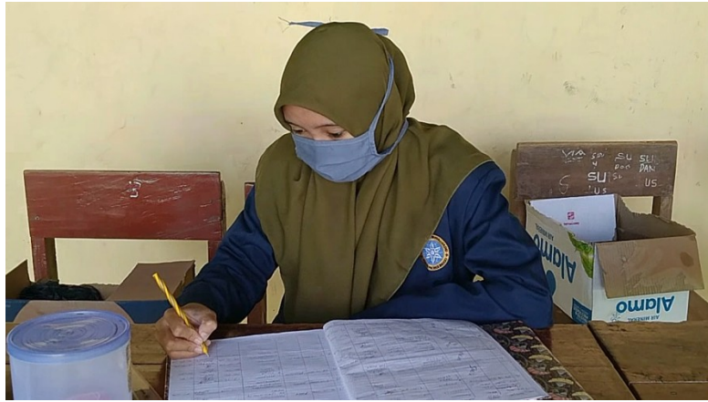
Gambar: Penjagaan posko dan rumah karantina