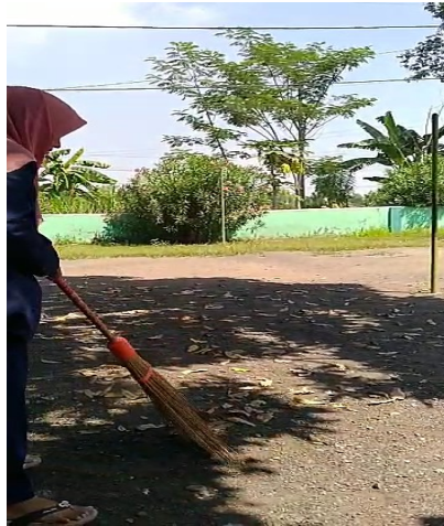
Gambar: membersihkan rumah karantina