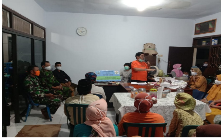
Gambar: Pengawasan bantuan langsung tunai dana desa