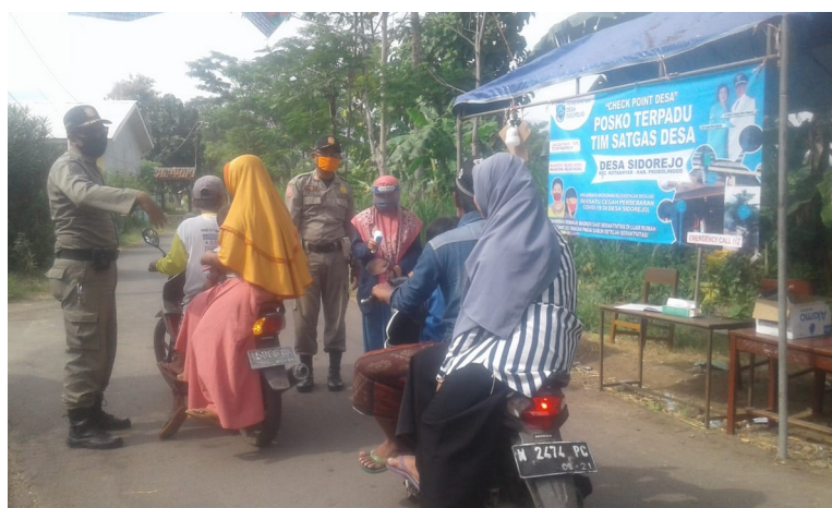
Gambar: pengecekan suhu dengan thermometer digital