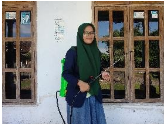
Gambar 2. Proses Penyemprotan Rumah Warga