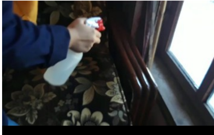
Gambar 4. Proses Penyemprotan Benda yang sering di Gengam