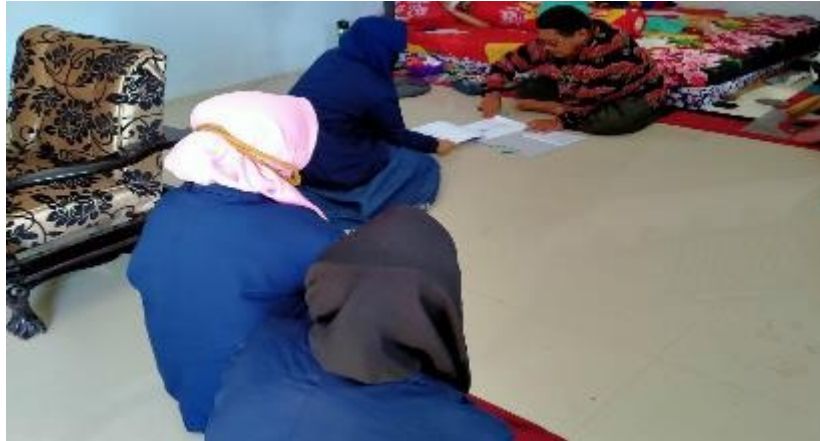
Gambar 1. Proses Izin Kepada Kepala Desa Karanganyar Paiton Probolinggo