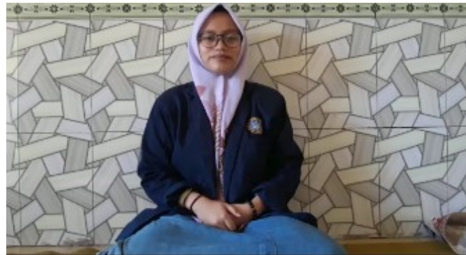
Gambar 5. Foto saat membuat video pembuka di depan Kamera