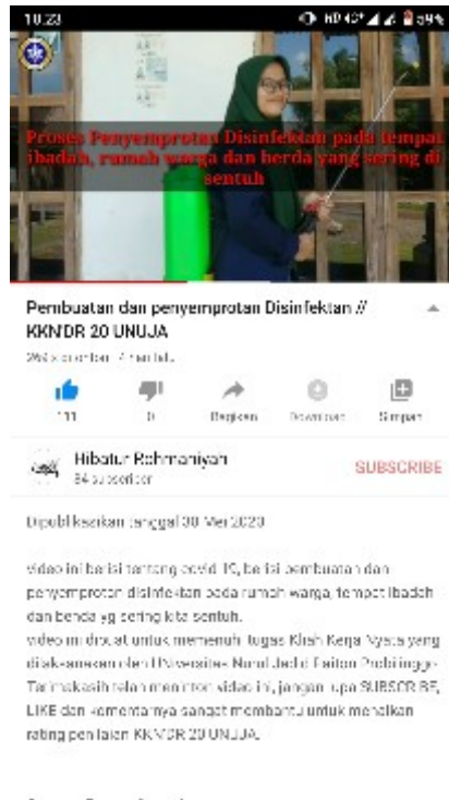
Gambar 7. Bukti Foto Capture bahwa video kegiatan sudah terunggah di YouTube