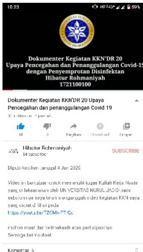
Gambar 8. Bukti Foto Capture bahwa video Dokumenter sudah terunggah di YouTube