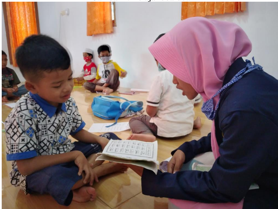
Gambar 5. Belajar mengaji