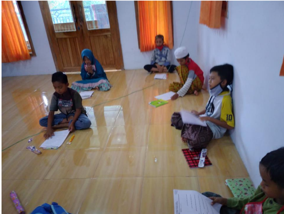
Gambar 4. Belajar doa-doa