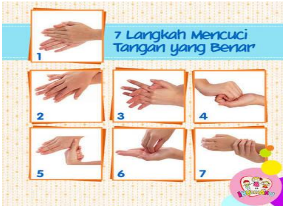
Gambar 8. Pamflet cuci tangan