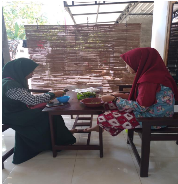
Gambar 1. Pembuatan handsenitizer