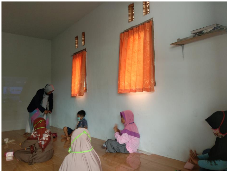
Gambar 3. Cara cuci tangan dengan benar