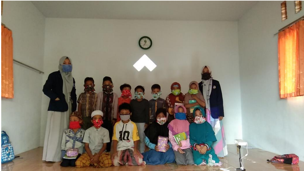
Gambar 6. Foto bersama anak-anak desa Potoa Daya