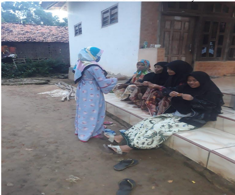
Gambar 7. Sosialisasi dan bagi-bagi ekstrak kunyit