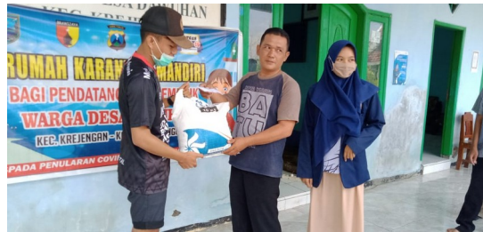
Gambar: pembagian PKH