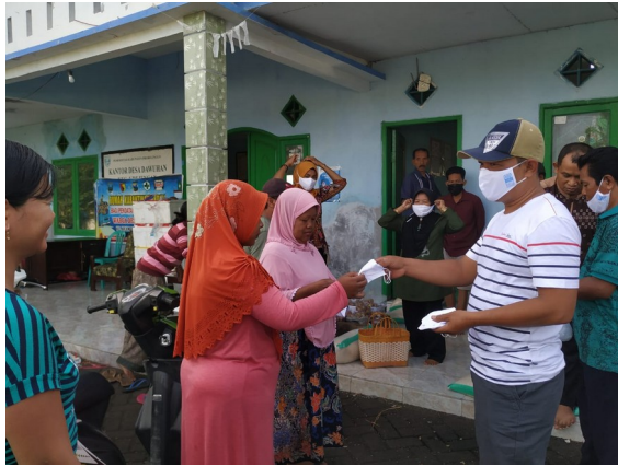
Gambar: pembagian masker