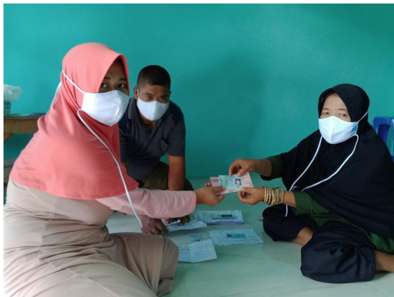
Gambar: pembagian bantuan langsung tunai