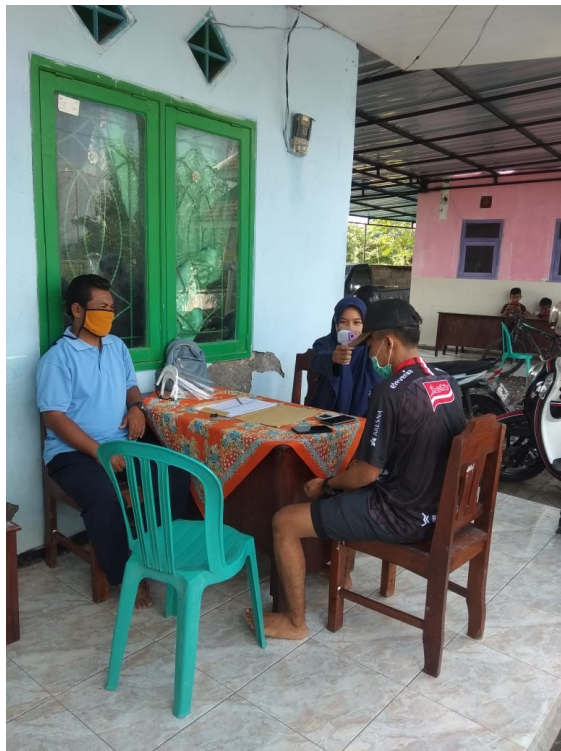
Gambar: Posko Terpadu Check Point Desa Dawuhan