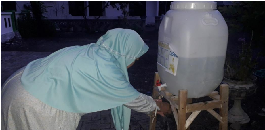
Foto salah satu Masyarakat sedang Cuci tangan