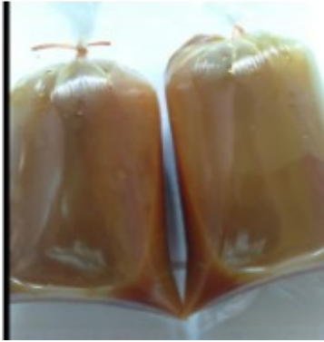
Pembagian empon-empon kepada masyarakat sekitar