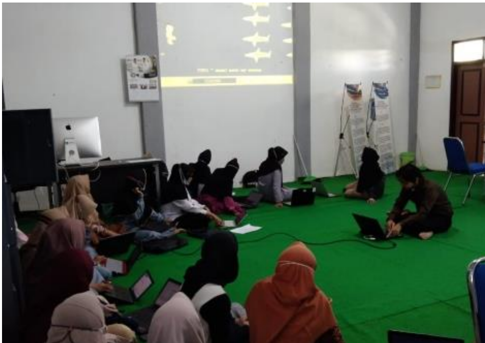
Gambar 1. Pertemuan pertama serta pengenalan aplikasi oleh tim

Kegiatan pengabdian ini dilaksanakan pada tanggal 4 Maret- 6 April 2021. Mitra dari kegiatan ini yaitu Santri SP3 Pondok Pesantren Nurul Jadid. Para peserta yang terlibat dalam kegiatan ini sebanyak 30 santri. Kegiatan pengabdian ini dilakukan langsung di Universitas Nurul Jadid, Probolinggo. Pada tahap perancangan dan persiapan, tim memberikan aplikasi berupa Typing Master Pro dan Typer Shark Deluxe kepada santri SP3 untuk diinstal dan dijelaskan cara penggunaannya. Gambar 1 menunjukkan pertemuan pertama serta pengenalan aplikasi oleh tim. Gambar 2 menunjukkan tim yang membantu peserta dalam proses instalasi.