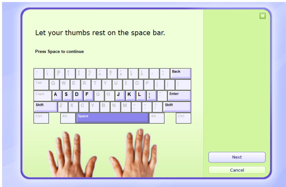
Gambar 3. Aplikasi Typing Master Pro

Aplikasi selanjutnya yaitu Typer Shark Deluxe . Typer Shark Deluxe merupakan sebuah game karya Popcap.com. yang dapat melatih agar cepat dalam mengetik sepuluh jari (Nafiah, 2015). Aplikasi ini juga berisi 3 mode permainan yang bisa digunakan. Untuk mahir dalam mengetik sepuluh jari bisa menggunakan mode typing tutor. Tampilan game Typer Shark Deluxe ditunjukkan pada Gambar 4.