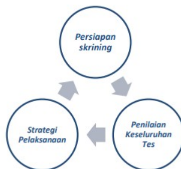
Gambar 1. Diagram Metode