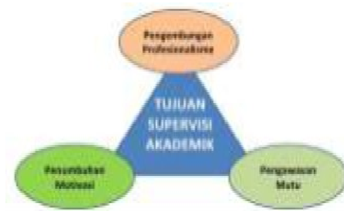
Gambar 1. Tujuan supervisi akademik

Kegiatan supervisi akademik bertujuan membantu guru dalam mengembangkan kompetensinya guna mencapai tujuan pembelajaran (Instructional goal) yang sudah ditentukan terhadap peserta didiknya. Menurut Sergiovanni dalam Ditjen Dikdasmen (2017), supervisi akademik bertujuan untuk pengembangan profesionalisme, pengawasan kualitas, dan penumbuhan motivasi. Jika digambarkan tujuan tersebut akan nampak sebagai berikut.