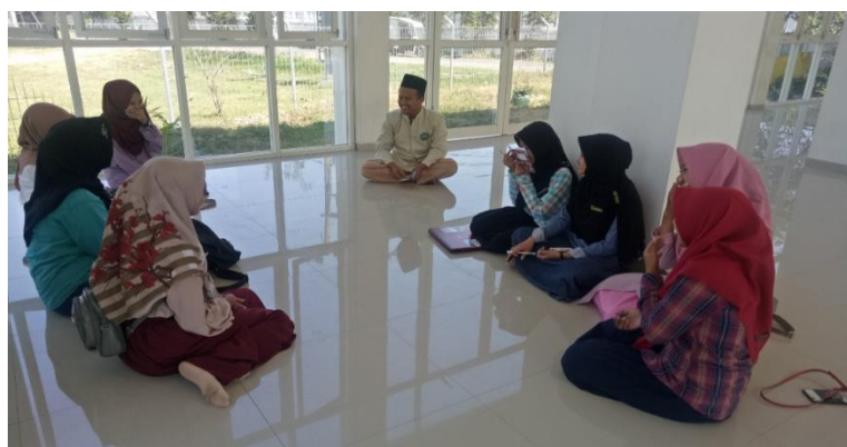
Gambar 2.2. Menentukan Tujuan dan target KKN yang akan dilaksanakan

Strategi pertama , melakukan diskusi seluruh kelompok KKN Sidodadi dengan DPL guna menentukan tujuan besar kegiatan KKN yang ingin dicapai dan menentukan Struktur pembagian tugas masing-masing anggota kelompok KKN,