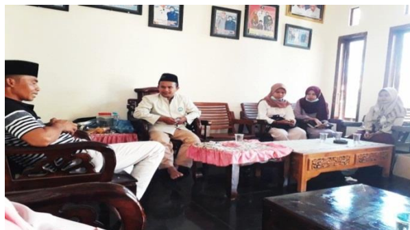
Gambar 2.5 Sosialisasi dan perizinan KKN yang akan dilaksanakan