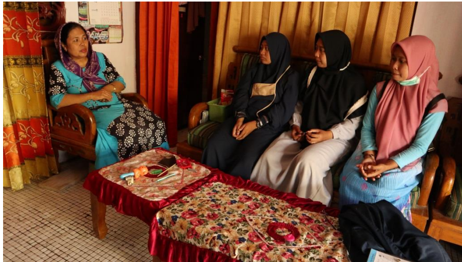
Gambar 2.5 Penyampain tujuan kegiatan KKN dan perizinan kepada Kepala Sekolah PAUD