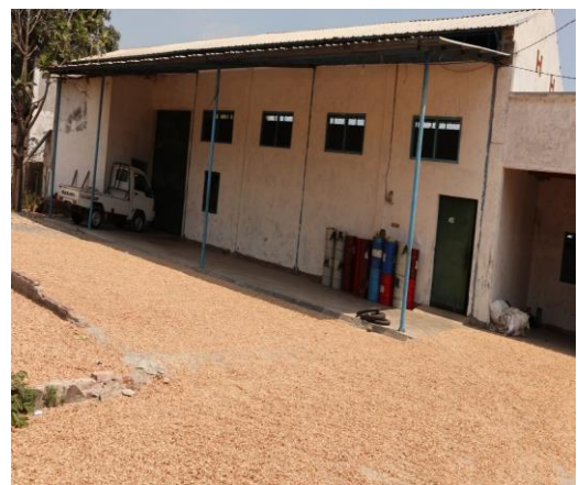
Gambar 2.6 Penyampain Rencana pembuatan Gambar 2.7 Tempat Penggilingan Padi