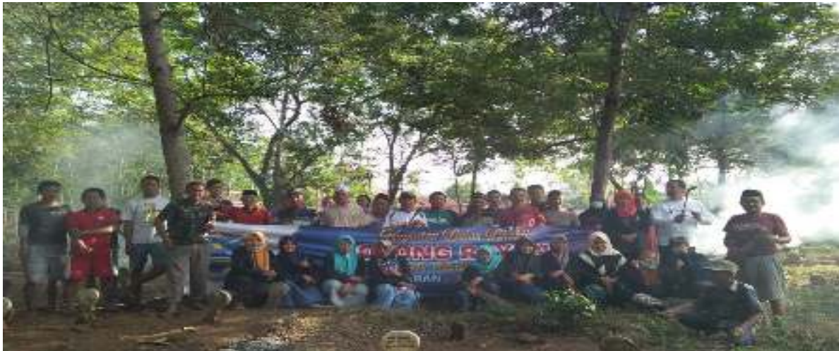
Kerja bakti TPU bersama warga sekitar dusun Masjid (Minggu, 05 Agustus 2018)