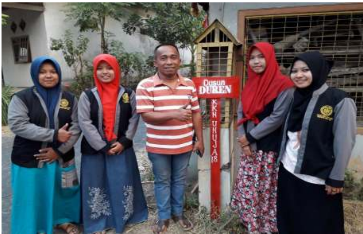
Pemasangan Papan nama dusun bersama Kepala dusun Duren dan Anggota Karang Taruna.