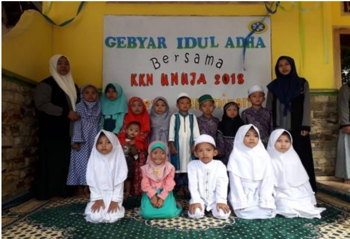
Pelaksanaan lomba surat pendek menyambut Hari raya idul adha di Posko desa Pakuniran (Rabu, 19 Agustus 2018)