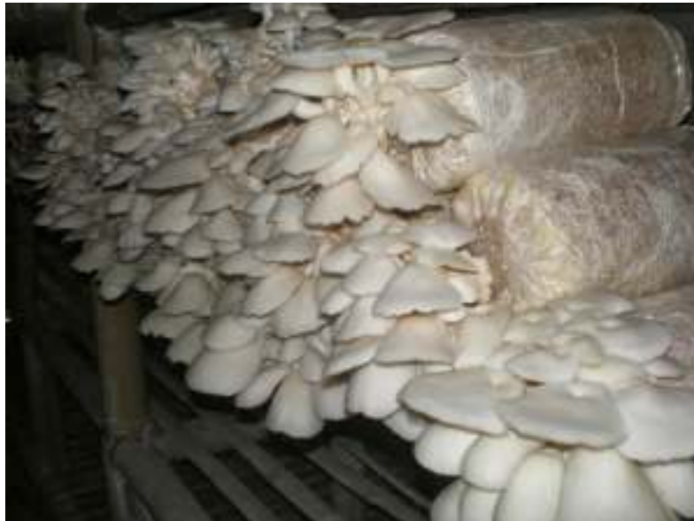
Gambar 1. Hasil pembiakan Jamur Tiram atau baglog

Desa Jabung Sisir merupakan salah satu desa penghasil jamur tiram di kecamatan paiton. Potensi jamur yang ada di desa Jabung Sisir cukup besar yaitu 2500 bag dengan hasil produksi 5-15 kg jamur tiram segar per hari. Jamur tiram merupakan salah satu jenis tanaman yang gencar dibudidayakan dan memiliki nilai ekonomis serta mampu dijadikan sebagai makanan pengganti seperti daging atau ikan karena memiliki kandungan karbohidrat maupun protein yang hampir sama. Terdapat berbagai macam jenis jamur yang dapat dikonsumsi seperti jamur tiram putih , jamur tiram abu-abu, jamur tiram coklat, jamur tiram hitam dan jamur tiram hitam dan jamur tiram kuning (martawijaya, 2010).