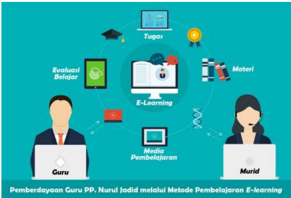
Lampiran 2. Gambaran Iptek yang akan dilaksanakan pada Mitra