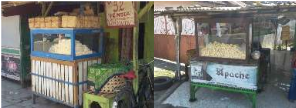
Gambar 1. Kios pedagang tape singkong di Desa Karanganyar

Desa Karanganyar adalah sebuah desa yang terletak di Kecamatan Paiton Kabupaten Probolinggo Propinsi Jawa Timur. Penduduknya sebagian besar berprofesi menjadi petani dan sebagian lainnya menjadi pedagang. Pedagang yang saat ini memberikan daya tarik bagi warga setempat adalah berjualan tape singkong warna kuning. Peluang tambahan pendapatan yang lumayan besar dari berdagang tape, karena tempat berjualannya yang sangat strategi, yaitu dekat pondok pesantren Nurul Jadid, sekolah (SD, SMP, SMA), pasar, dan pinggir jalan raya Provinsi Jawa timur yang menuju kearah pulau Bali. Rata-rata penjualan tape di para pedagang ini sekitar 5 ton per hari. Gambar sebagian kecil pedagang tape singkong di Desa Karanganyar yang berjualan di Desa Karanganyar diperlihatkan pada Gambar 1.