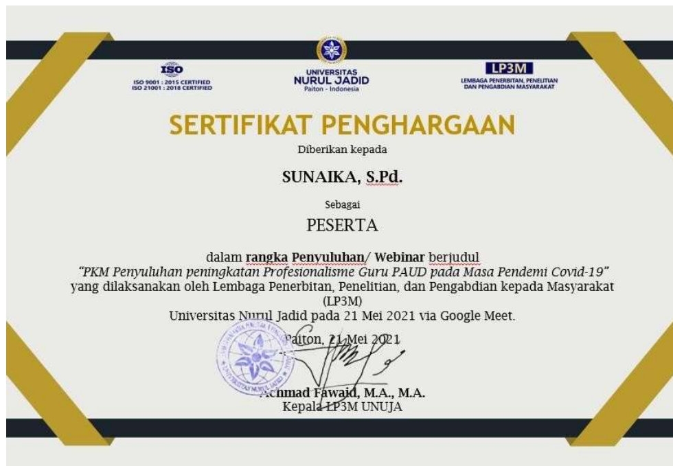
Gambar 4. Contoh sertifikat peserta penyuluhan