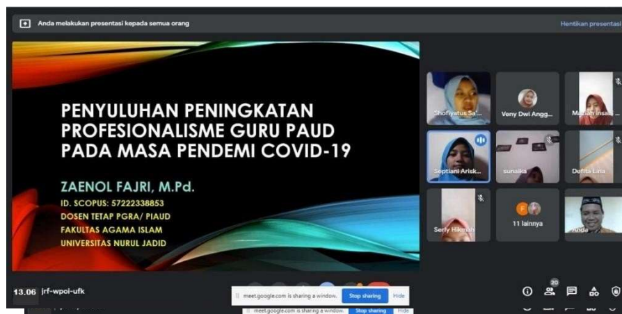
Gambar 2. Aktivitas kegiatan awal penyuluhan (perkenalan pemateri)

Kegiatan pengabdian ini diikuti oleh beberapa guru Kelompok belajar (KB) dan guru PAUD/ TK, baik lembaga swasta maupun negeri. Pelaksanaan dilakukan hari Jum'at 21 Mei 2021 dimulai jam 13.00 sampai jam 15.00 dengan berbagai penjelasan materi, diskusi/ tanya jawab tentang profesionalisme guru PAUD yang diawali dengan definisi seorang guru, definisi profesi, professional, profesionalitas, profesionalisme, tugas dan peran seorang guru di lembaga pendidikan terutama pada masa pandemi covid-19.