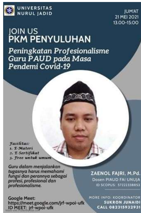
Gambar 1. Poster pengumuman pelaksanaan penyuluhan

Pada saat pelaksanaan berlangsung diawali dengan ucapan salam dan berdoa sesuai keyakinan masing-masing agar pelaksanaan penyuluhan dapat berjalan dengan lancar dan ilmunya bermanfaat. Penyuluhan ini dilaksanakan secara daring menggunakan aplikasi Google Meet.