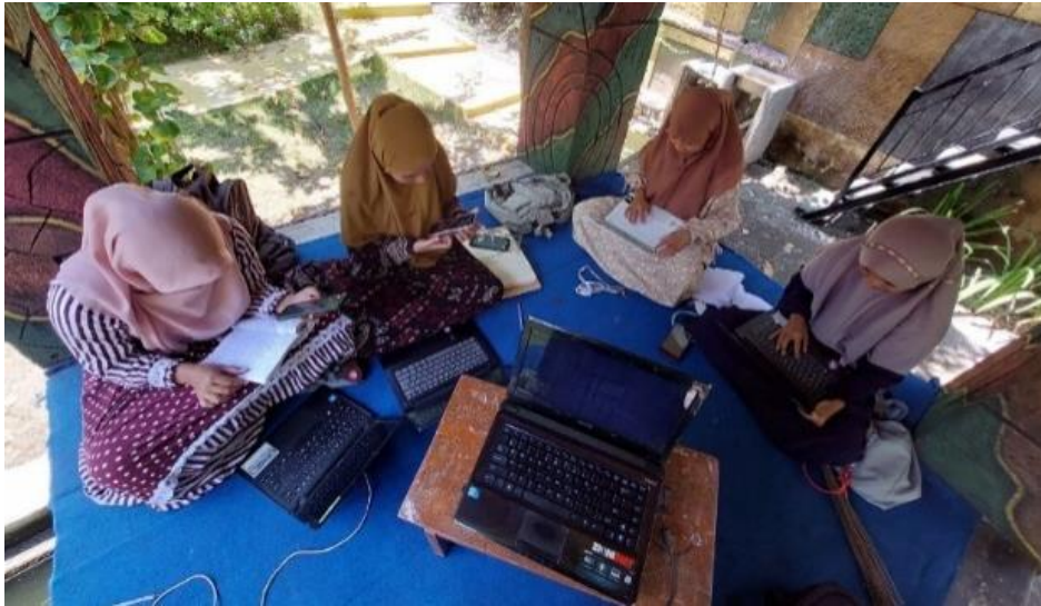
Gambar 2. Perumusan materi kegiatan