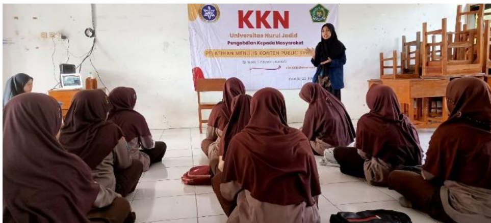
Gambar 3. Pelaksanaan pretest

Pelaksanaan pendampingan menulis konten public speaking diawali dengan pelaksanaan pretest (lih. Gambar 3 ) untuk mengukur kemampuan siswa dalam menulis konten public speaking. Pretest dilaksanakan pada tanggal 23 Juni 2022.