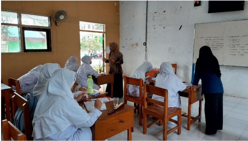
Gambar 4. Pendampingan menyusun naskah public speaking

Dari Gambar 4 , terlihat siswa antusias dan serius dalam membuat naskah public speaking sesuai arahan yang telah disampaikan oleh tim pengabdian kepada masyarakat. Pemberian materi terkait penulisan naskah public speaking dilaksanakan sebanyak 3 pertemuan. Pertemuan pertama membahas tentang penentuan tema untuk naskah public speaking, dilanjutkan dengan pengumpulan bahan materi di perpustakaan sekolah. Pertemuan kedua membahas penyusunan kerangka naskah public speaking dilanjutkan dengan membuat naskah dengan mengembangkan ide sesuai tema. Pertemuan ketiga diisi dengan praktik membuat naskah public speaking secara lengkap. Hasil tulisan siswa dievaluasi bersama teman sejawat agar mereka mengetahui apa yang seharusnya diperbaiki. Pertemuan keempat dilakukan post-test. Tes ini digunakan sebagai Langkah evaluasi pemahaman peserta terkait materi pelatihan penulisan konten public speaking. Hasil post-test menunjukkan 90% sudah dapat menulis konten secara utuh sesuai sistematika penulisan konten public speaking.