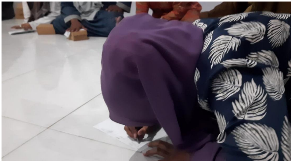
Gambar 1 . Registrasi/Pengisian Daftar Hadir

Program pengabdian masyarakat dengan kegiatan pelatihan dan pendampingan perawatan Luka Diabetes Militus dapat dilanjutkan dengan mengevaluasi luka yang ditangani oleh keluarga yang terlatih setiap minggu sekali. Kegiatan pengabdian masyarakat ini juga melibatkan Dosen pembimbing lapang, Mitra Paguyuban Diabetes Klinik Az-Zaniyah Pondok Pesantren Nurul Jadid dan Mahasiswa Fakultas Kesehatan Universitas Nurul Jadid. Tujuannya agar mahasiswa juga dapat memberikan contoh dan terlibat langsung ke masyarakat untuk mempraktekkan ilmu yang telah diperoleh di bangku kuliah.