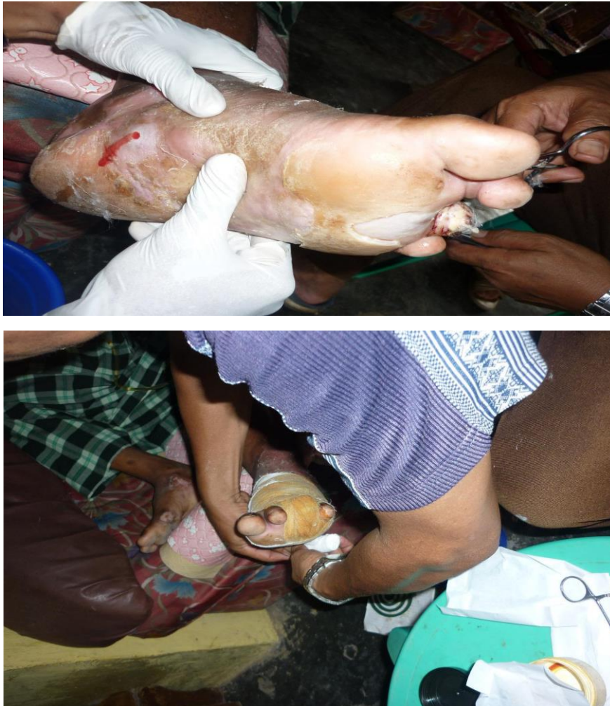
Gambar 6. Perawatan luka menggunakan alat sederhana

Peserta sangat berantusias selama sesi pematerian dan pelatihan perawatan luka. Peserta juga berdiskusi dalam sesi Tanya jawab saat di ahir pematerian dan pelatihan perawatan luka Diabetes.