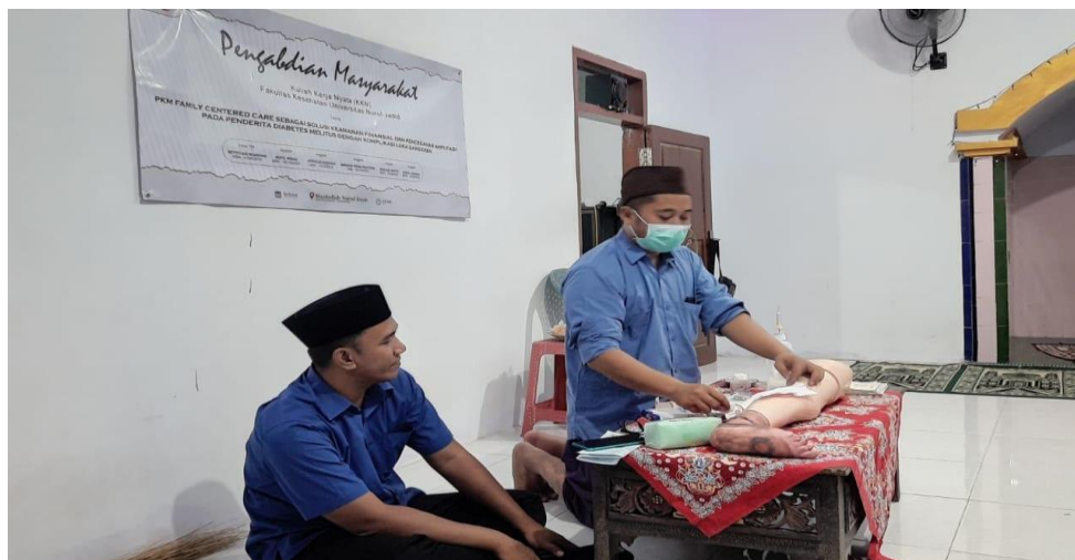
Gambar 3. Pelatihan perawatan luka Diabetes Militus

Materi Penyuluhan Diabetes Militus pada Masyarakat Desa Karang Anyar adalah Pengertian dan cara perawatan luka Diabetes yang benar dan sederhana. Secara mandiri.