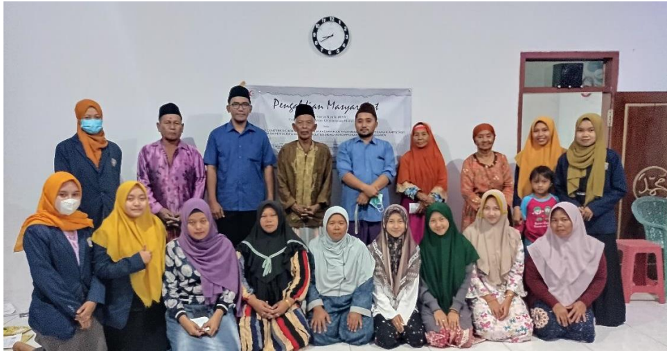
Gambar 7. Dokumentasi Bersama

Setelah pemberian materi dan pelatihan perawatan luka Diabetes Militus secara mandiri atau FCC kepada keluarga mitra . dilanjutkan dengan Dokumentasi Bersama.