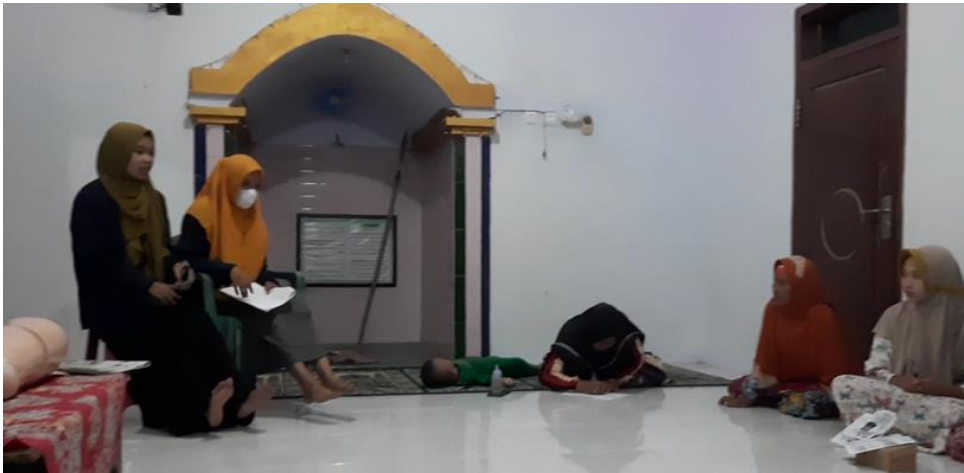
Gambar 4. Mahasiswa mengajarkan Gerakan-gerakan Senam Kaki Diabetes

Tetapi mitra bisa menggunakan air hangat sebagai pengganti cairan NaCl untuk menghemat biaya finansial perawatan luka diabetes secara mandiri.