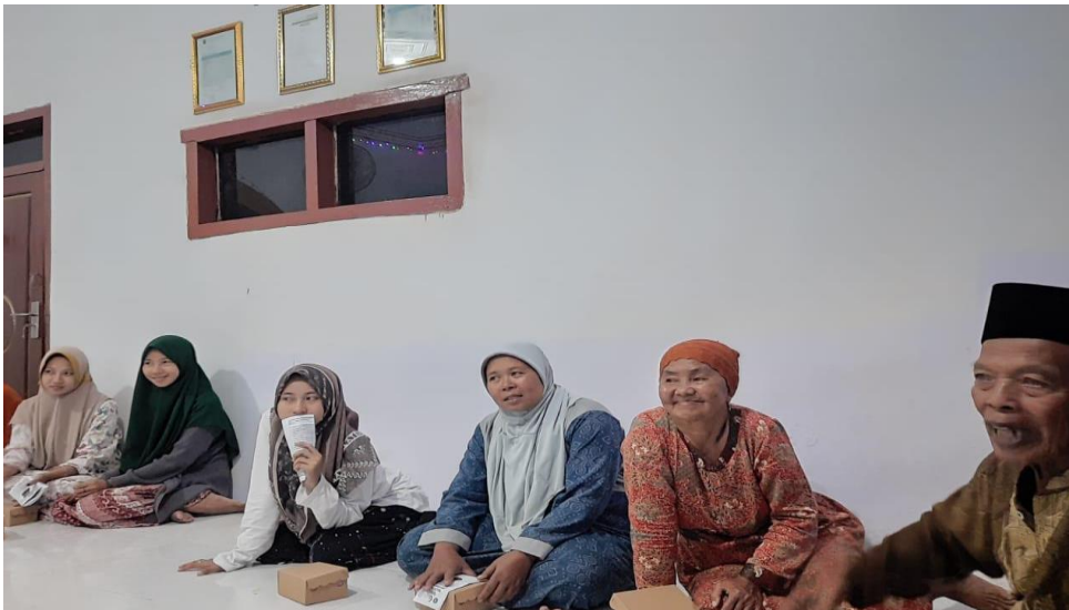
Gambar 5. Antusias peserta dalam pelatihan perawatan luka dan Pematerian

Mahasiswa juga memberikan contoh Gerakan-gerakan senam kaki diabetes yang benar kepada peserta.