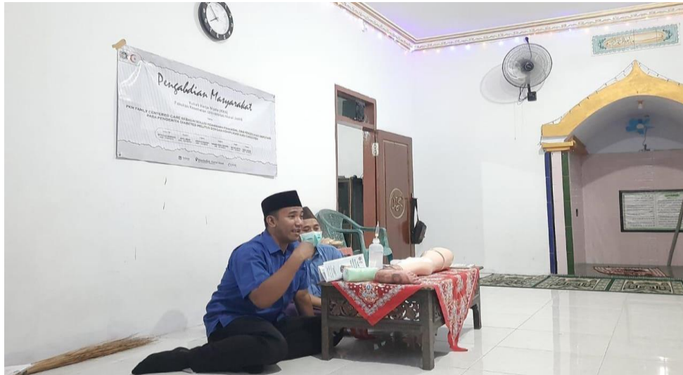
Gambar 2. Penyampaian materi Diabetes Militus

Materi Penyuluhan Diabetes Militus pada Masyarakat Desa Karang Anyar adalah Pengertian dan cara perawatan luka Diabetes yang benar dan sederhana. Secara mandiri.