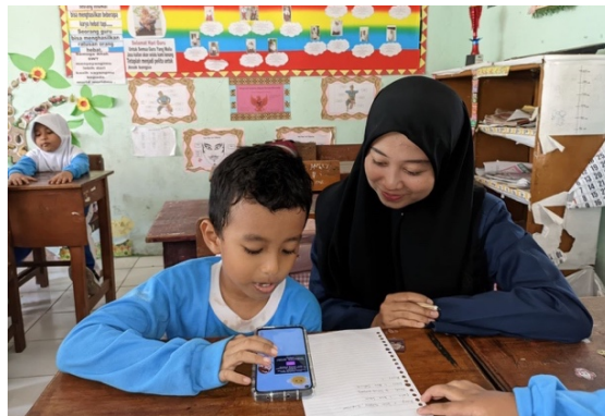
Gambar 6. Tim Pelaksana Mendampingi Siswa yang Sedang Mencoba Gim

Selanjutnya, siswa berkumpul dengan kelompoknya. Pendamping mengujicobakan gim edukasi pada setiap siswa dalam kelompok dan mencatat berapa banyak siswa yang sudah memahami bangun datar yang dikenalkan pada gim. Tugas pendamping pada kegiatan ini adalah membantu siswa dalam mengoperasikan gim edukasi, tetapi tidak menjelaskan materi karena gim sudah dilengkapi dengan penjelasan materi berupa gambar, animasi, dan suara. Gambar 6 menunjukkan siswa yang sedang mencoba memainkan gim edukasi yang dikembangkan. Setelah mencoba gim edukasi pengenalan bilangan. Siswa diminta untuk mengisi angket untuk mengetahui respon siswa terhadap gim edukasi yang dikembangkan.