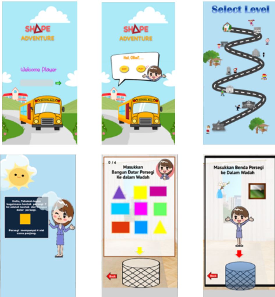
Gambar 3. Tampilan Gim Pengenalan Bangun Datar