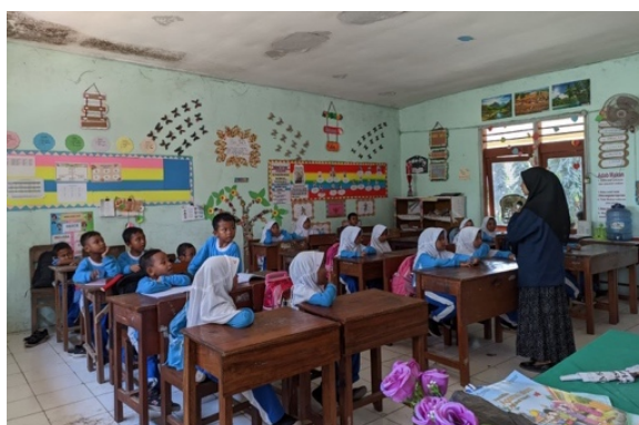
Gambar 5. Tim Pelaksana Melakukan Tanya Jawab

Pada awal kegiatan, tim melempar beberapa pertanyaan untuk mengecek pemahaman siswa mengenai bangun datar, seperti yang ditunjukkan oleh Gambar 5. Kebanyakan siswa hanya menyebutkan bangun datar persegi, persegi panjang, lingkaran, dan segitiga. Siswa belum mengenal ciri-ciri dari bangun datar jajar genjang, belah ketupat, dan layang-layang.