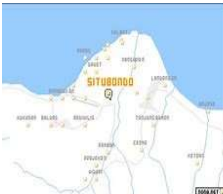
Gambar 3. Aplikasi Google Maps

Mendaftarkan lokasi pada google maps . Pendaftaran lokasi pada google maps :