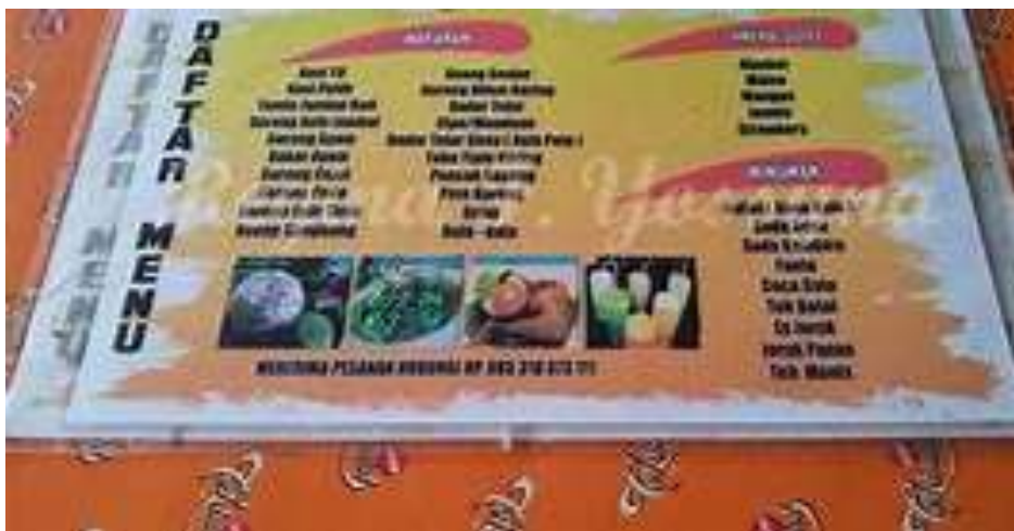
Gambar 6. Papan nama yang disertai denga daftar menu