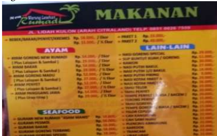
Gambar 4. Daftar menu kuliner

Bentuk Pemasaran lain berbentuk daftar menu, Logo usaha dan papan nama. Sebagaimana gambar dibawah ini :