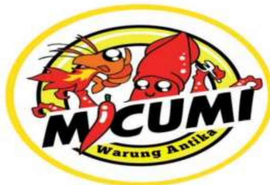
Gambar 5. Logo produk Cumi Andalan