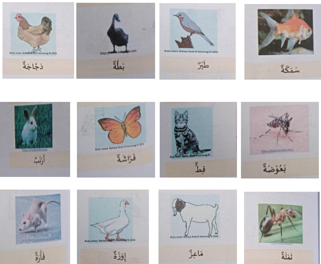
Gambar 4: Media Kartu Flashcard

Pada pertemuan ketiga peneliti melakukan pengulangan kosa kata yang telah diberikan pada minggu sebelumnya dan ketika siswa sudah menghafal kosa kata tersebut, lalu kita memberikan kosa kata yang baru tentang hewan.