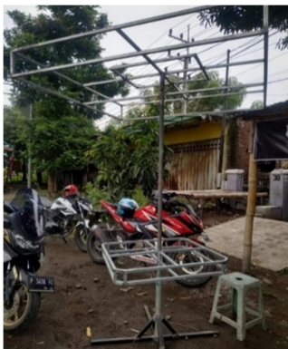
Gambar 3. Kerangka Besi Payung JAYUS

Untuk design kerangka besi dari meja payung JAYUS bisa di lihat seperti pada Gambar 3, kerangka ini sengaja di buat design yang mudah di bongkar pasang, agar pengguna dapat membawa meja payung ini dengan mudah, Atap payung, meja, tiang dan alas kaki dari payung bias di lepas: