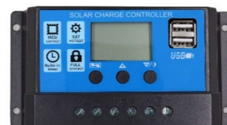
Gambar 2. Solar Charger Control

Tegangan DC yang dihasilkan oleh panel sel surya umumnya bervariasi 12 volt ke-atas.