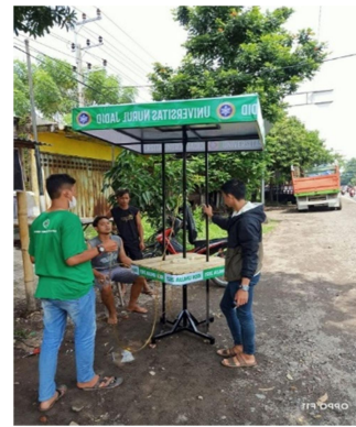
Gambar 4. Meja Payung Solar Cell (JAYUS)